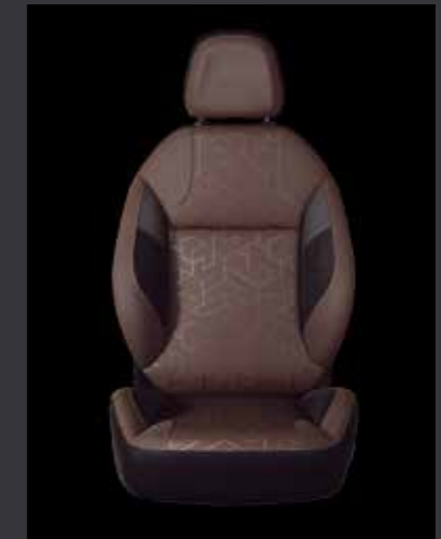
2. Ткань Tokyo Brundy