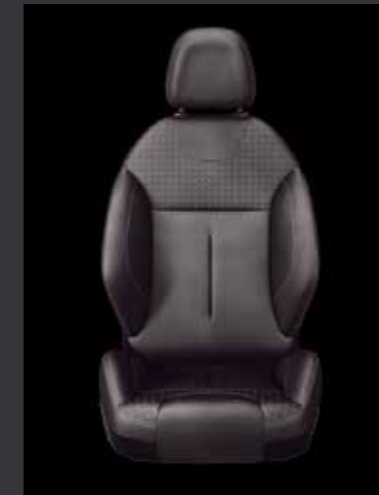
1. Кожa Claudia Mistral (1)

Выберите обивку * для Вашего автомобиля из предлагаемых вариантов: кожа или ткань