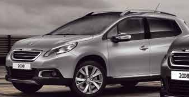
Серый (Gris Artense)