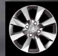
15" легкосплавный колесный диск Iode (1)

Также представлен широкий ассортимент колесных дисков для Вашего Peugeot 2008.