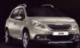
Серый (Spirit Grey)