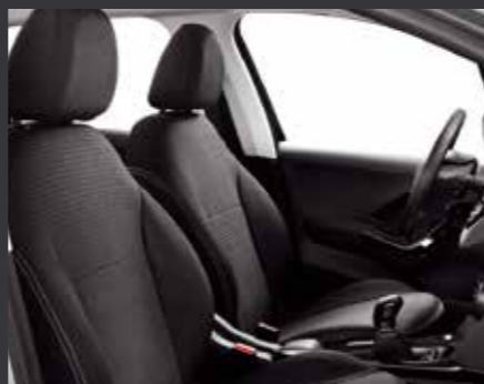
Чехлы для сидений