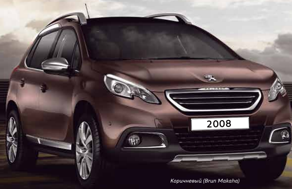
Коричневый (Brun Makaha)