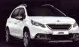
Белый (Blanc Vanquise)

(1) В зависимости от версии автомобиля. (2) В зависимости от версии автомобиля, только для версий, оснащенных системой Grip Control®.