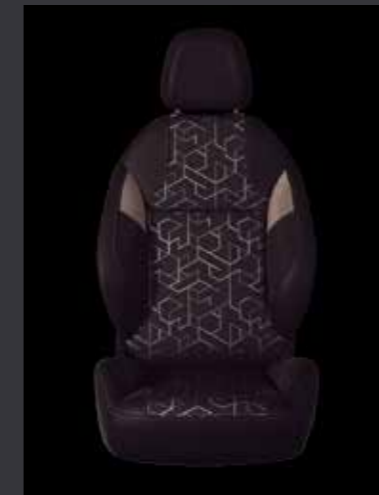
3. Ткань Tokyo Mistral