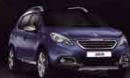
Синий (Bleu Virtuel)