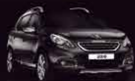
Черный (Noir Perla Nera)