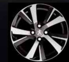
Eridan 17" легкосплавный колесный диск «металлик» Noir Brillant (2)