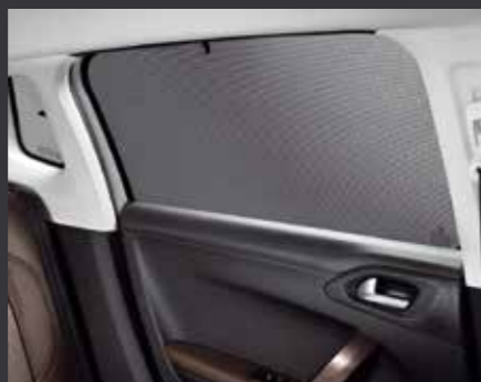
Боковые солнцезащитные шторки