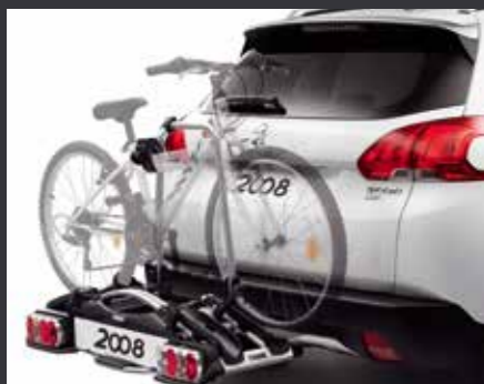
Велоплатформа для двух велосипедов на фаркопе