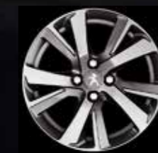
Eridan 17" легкосплавный колесный диск «металлик» Gris Anthra Mat (1)