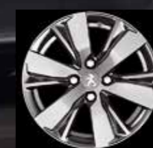
Hydre 16" легкосплавный колесный диск «металлик» Gris Dilium Brillant (1)