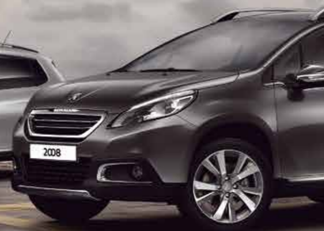
Серый (Gris Platinum)