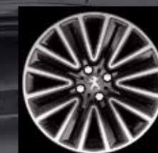
16" легкосплавный колесный диск Silice (1)