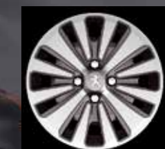
16" легкосплавный колесный диск Strontium (1)