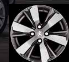
Hydre 16" легкосплавный колесный диск «металлик» Gris Ten Mat (2)