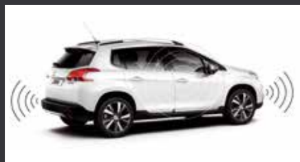
Задние датчики системы помощи при парковке

Откройте для себя ассортимент аксессуаров модели Peugeot 2008 в дилерской сети Peugeot.