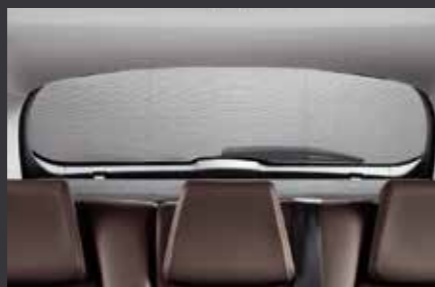
Задняя солнцезащитная шторка