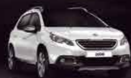
Белый (Blanc Nacré)