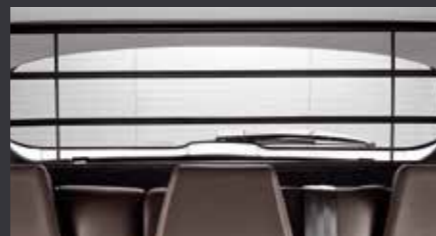
Защитная решетка для перевозки животных