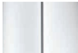
Белый (Blanc Vanquise)