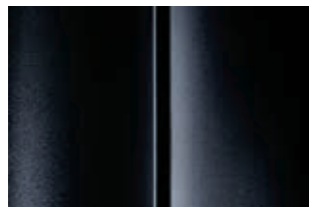
Черный (Noir Perla Nera)