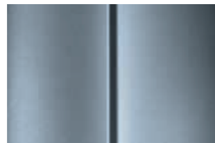
Серебристый (Gris Alu)