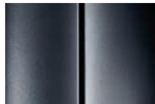
Серый (Gris Shark)