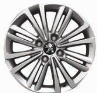
Легкосплавные диски Sansiro 16" (Active, Allure)